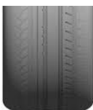
Te lage spanning

9-Controleer regelmatig uw bandenspanning . Door een te lage bandenspanning verhoogt u de weerstand en draagt daarmee bij aan een tot 5% hoger brandstofgebruik.