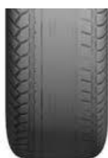
Te hoge spanning